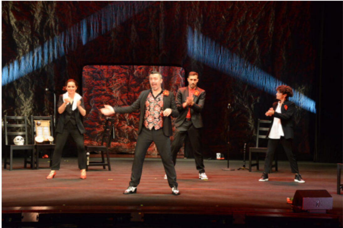
Gli Oblivion in un momento del loro ultimo spettacolo “Oblivion Rhapsody Unplugged”.

Addirittura padre Dante che in un inferno tutto particolare ascolta i vari drammi dei cantanti.