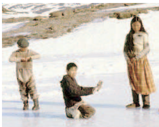
IL FILM Area Metropolis, Paderno, 18, 25 marzo, 1 aprile

La Groenlandia mi affascina molto: prima di girare ho imparato la lingua per non arrivare da colonizzatore