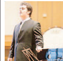
Il pianista Igor Levit suona al Conservatorio per la Società dei Concerti